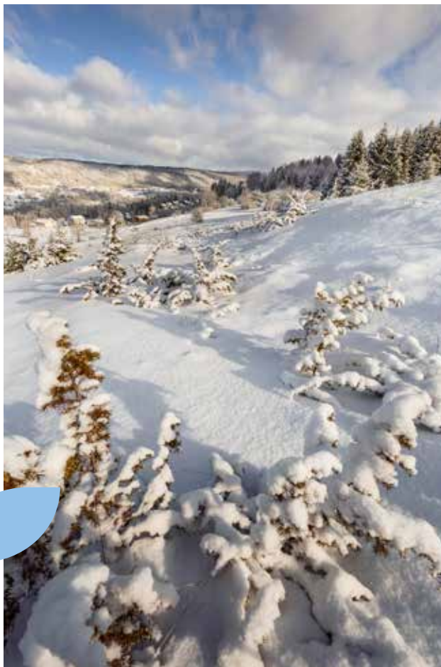
Plaine enneigée sur la vallée

Découvrez nos paysages hivernaux juste pour le plaisir des yeux !