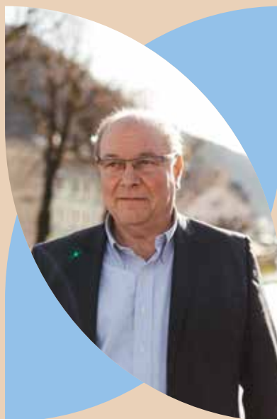
Laurent Petit Maire des Hauts de Bienne Morez - La Mouille - Lézat