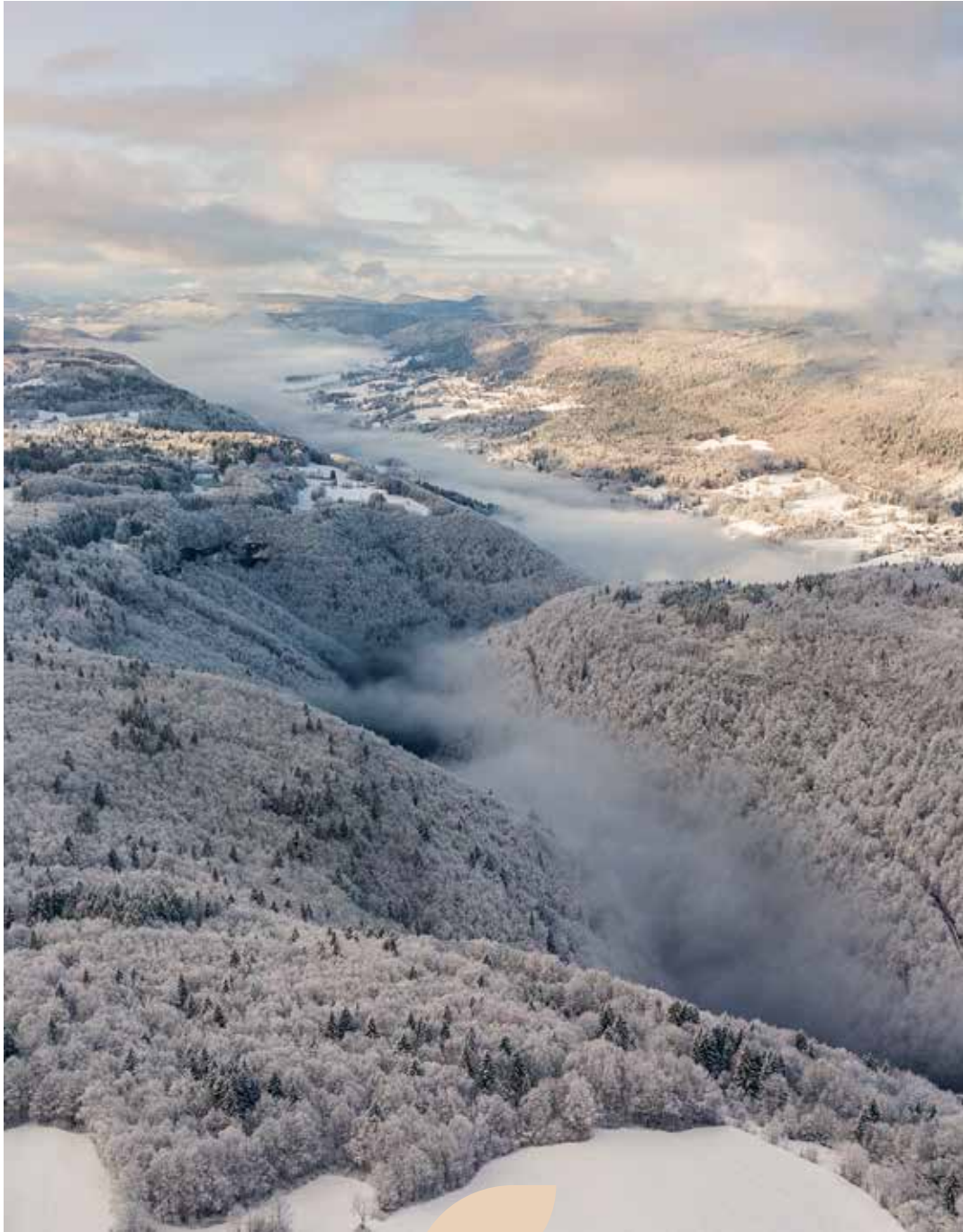
Vue aérienne des gorges de la Bienne