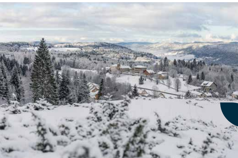
Le village depuis le belvédère du Bevet